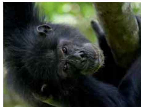
Schimpanse im Kibale Nationalpark