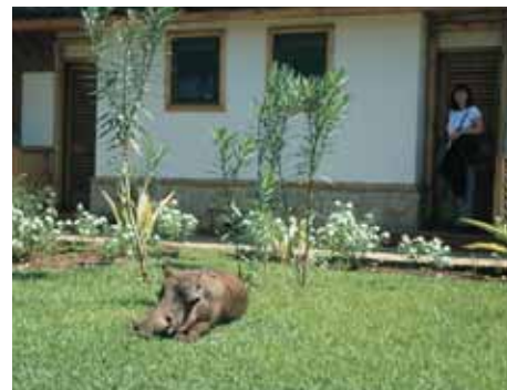
Die Safari beginnt am Hotel