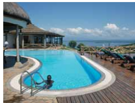
Die noble Mweya Lodge