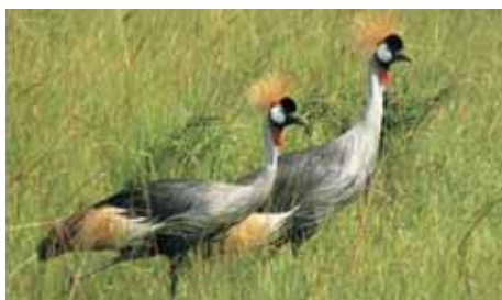
Kronen-Kraniche sind die Nationalvögel

»Uganda ist nach wie vor das wirtschaftlich und politisch stabilste Land Ostafrikas... Für die Grenzregion im Süden zu Ruanda und zum Kongo besteht nach unserer Einschätzung keine höhere Gefährdungslage... Trekking Reisende zu den Berggorillas in dieser Grenzregion gehen im übrigen ausschließlich in Gruppen und werden nach wie vor von erfahrenen Wildhütern mit militärischem Begleitschutz geführt«. Dr. Wolfgang Wiedmann, Honorarkonsul Uganda. Aktuelle Sicherheitshinweise finden Sie unter www.auswaertiges-amt.de .