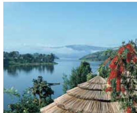
Blick über den Lake Bunyonyi