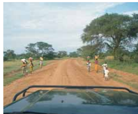
On the road again...