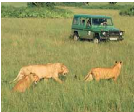
Die Löwen im Queen Elizabeth NP

Uganda liegt zwar genau am Äquator, doch im Hochland liegen die Durchschnittstemperaturen bei angenehmen 22 bis 25 °C. Im Tiefland steigen die Temperaturen zeitweise auf über 32 °C. Jedes Jahr gibt es zwei Perioden, in denen es etwas mehr regnet: von Mitte März bis April und von Oktober bis Mitte November.