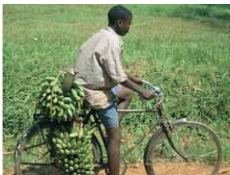
Auf dem Weg zum Markt