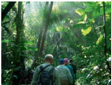
Schimpansen Trekking im Kibale NP

Bei Reisen nach Uganda ist der Besuch eines Tropenarztes ratsam. Zwingend vorgeschrieben ist für Reisende aus Gelbfieber-Gebieten eine Gelbfieber-Impfung. Die Einnahme einer Malaria-Prophylaxe, sowie Schutzimpfungen gegen Typhus, Cholera und Hepatitis A werden empfohlen. Mehr Infos unter: www.fit-for-travel.de . Für die Einreise nach Uganda besteht Visumpflicht. Sie erhalten von uns sämtliche Unterlagen, die Sie bei der Botschaft mitsamt Reisepass einschicken müssen. Der Reisepass muss nach Ankunft in Uganda mindestens noch 6 Monate gültig sein.