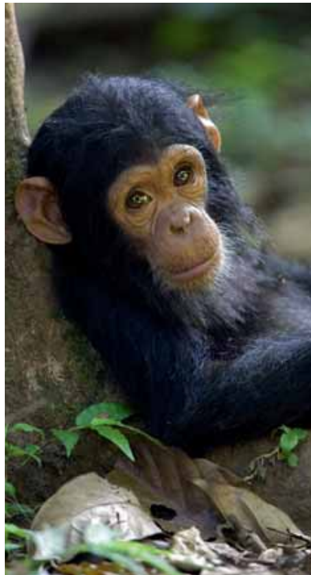
Ist er nicht süß?

Der 125 km 2 große PN des Volcans liegt im äußersten Nordwesten Ruandas mit bis zu 4.507 m hohe Vulkane. Die Vegetation besteht hauptsächlich aus dichtem, undurchdringlichem Bergregenwald. Doch Ihr Ranger schlägt für Sie mit einer Machete