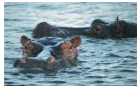
Flusspferde, die gefährlichsten Tiere Afrikas!

Im Karisimbi-Gebiet im PN des Volcans in Ruanda, wo auch Dian Fossey ihre berühmten Feldstudien durchführte, werden Sie am Gorilla Trekking teilnehmen. Hier sind sieben Gorilla-Gruppen an die Menschen gewöhnt worden. Der anstrengende Fußmarsch durch dichtes Unterholz ist nur für