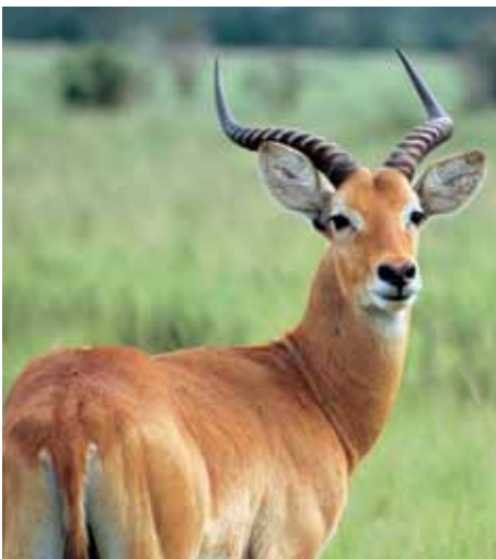
Uganda-Antilope im Queen Elizabeth NP

Unter www.berggorillas.de finden Sie mehr Informationen über die bedrohten Berggorillas.