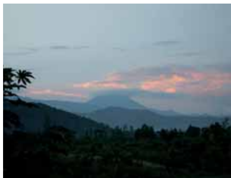
In den Virunga-Bergen

turliebhabern verschlägt es hier die Sprache. Die mächtigen bis zu zwei Meter großen Gorillas leben in erstaunlich friedfertigem Familienverband von 9-35 Tieren, der von einem bis zu 170kg schweren »Silberücken« angeführt wird. Wenn Sie strikt den Anweisungen Ihres Guides folgen, können Sie sich bis auf wenige Meter der Gorilagruppe annähern. Sie verhalten sich weit weniger aggressiv als die Schimpansen und sind nahezu lautlos. Die meiste Zeit des Tages sind sie am Fressen oder Faulenzen. Sie sind übrigens reine Vegetarier.