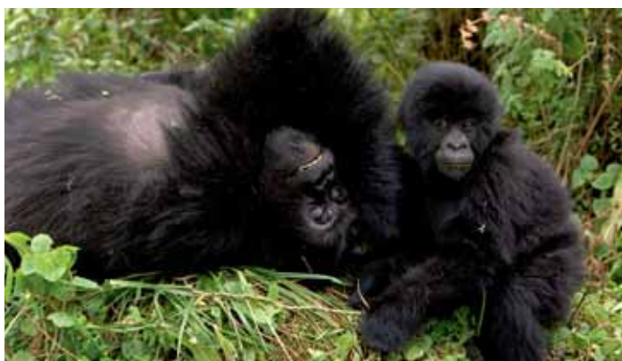
Die Berggorilla-Population ist am Wachsen

Schimpansen hoch oben in den Bäumen. Ü/HP wie zuvor.