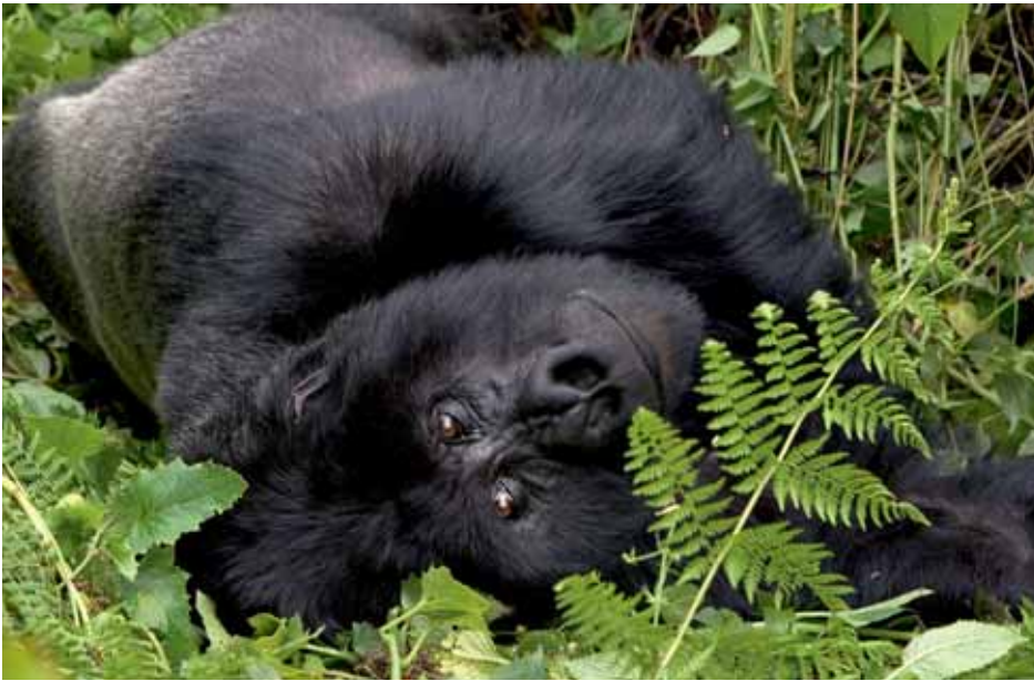
Auch ein Silberücken macht gern ein Mittagsschläfchen

kerngesunde Teilnehmer mit guter Kondition geeignet. In Ruanda dauert das Trekking 2-4 Stunden und ist weniger anstrengend als in Uganda. Trotz höchster Wahrscheinlichkeit kann keine Garantie für eine Sichtung gegeben werden, da die Gorillas in ihrem 10 bis 15 km 2 großen Revier umherwandern. Doch da der Führer weiß, wo sie sich am Tag zuvor aufgehalten haben, kann man gut ihren frischen Fressspuren folgen. Laut der jüngsten Zählung ist die Zahl der Berggorillas auf lediglich 700 Tiere weltweit geschrumpft. Das Erlebnis, vor einigen der letzten Berggorillas zu stehen, kann man nicht beschreiben. Selbst weit gereisten Na-