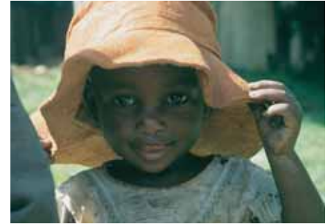
»Muzungu« – Hallo Fremder!

Das Beobachten von Berggorillas ist sicherlich der Höhepunkt einer jeden Reise nach Uganda und Ruanda. Doch da das Trekking auch recht anstrengend ist, haben wir es nicht fest im Programm. Falls Sie es machen möchten, geben Sie dies bitte bei der Buchung mit an. Das Trekking findet als optionale Leistung mit englischem Guide statt. Die wenigen Permits müssen sehr früh beantragt werden, denn die Gorilla-Touren