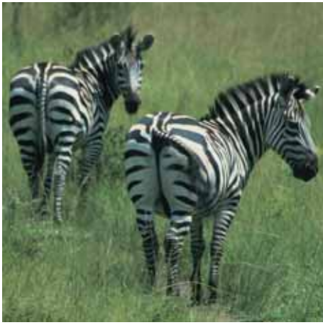
Zebras im Lake Mburo NP