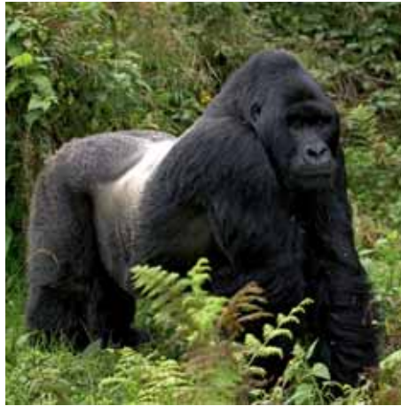
Ein stolzer Silberrücken

F ür alle, die sich ausschließlich für die Berggorillas und Schimpansen interessieren, ist diese Tour genau das Richtige! Sie konzentrieren sich auf den Südwesten Ugandas und den Parc National des Volcans in Ruanda, in dem schon Dian Fossey geforscht hat. Sie besuchen zunächst den Kibale Nationalpark, der für seine höchsten Primatendichte Afrikas berühmt ist. Nach bis zu zwei Schimpansen-Trekking geht es zum Bwindi Nationalpark. Das erste Gorilla-Trekking macht süchtig! Und deswegen ist in Ruanda auch noch eine weitere Tour zu den Berggorillas inklusive. Nach dieser Reise sind Sie zum echten Kenner der Sanften Riesen geworden.